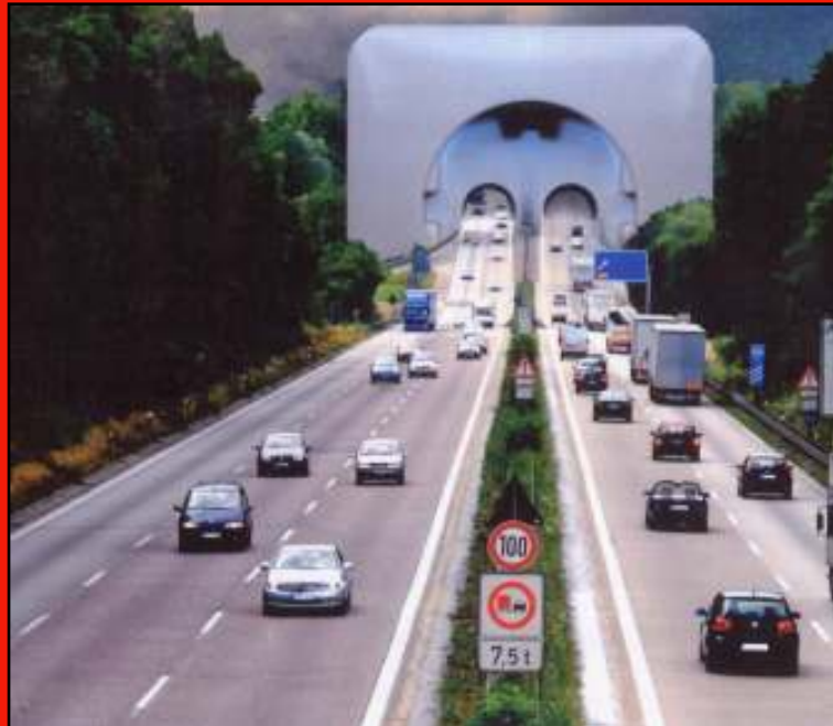
Abbildung aus: Automobilindustrie 7-8/2008